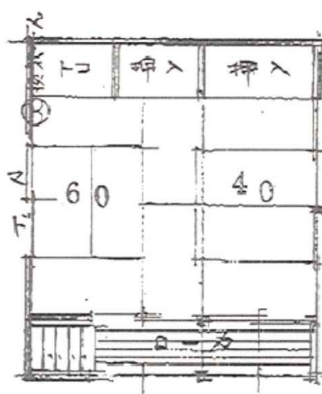
2 階 平 面 図