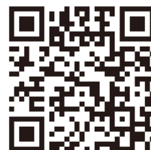
用智能手机作成申报书

有两份工资收入的人，或养老金收入，副业等的杂项收入的人都可以用智能手机进行申报。