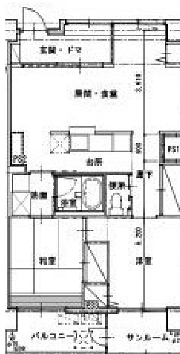
【東安居団地 D 棟 2LDK】