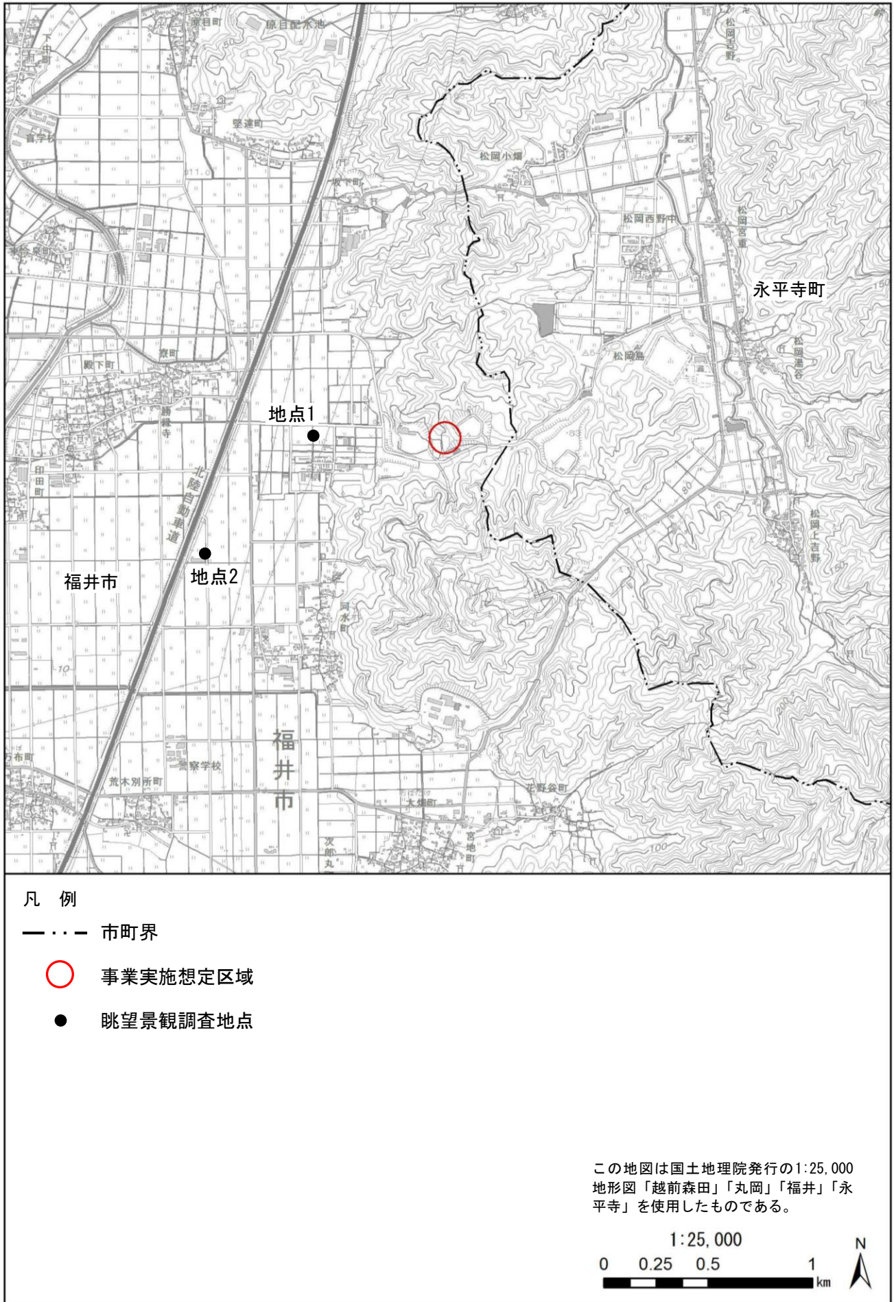
図 5.2-1 事業実施想定区域周辺の眺望点