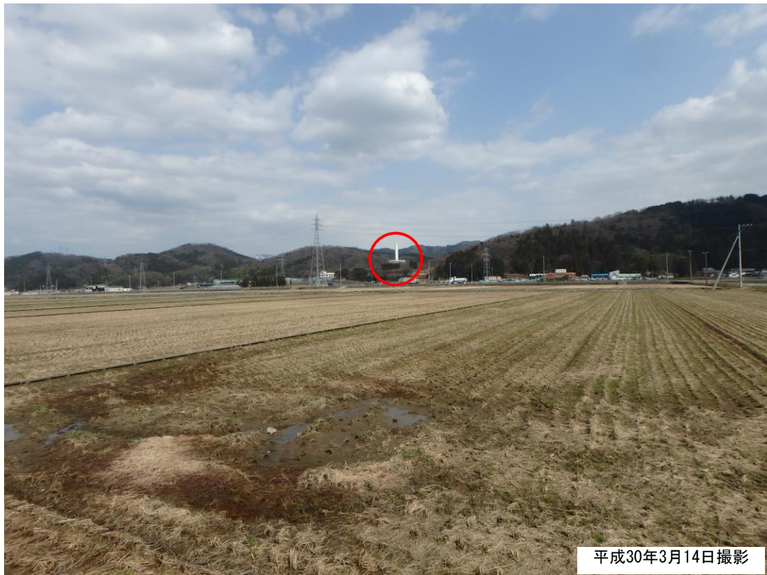
図 5.2-2(2) 事業実施想定区域周辺の眺望景観 (地点2)