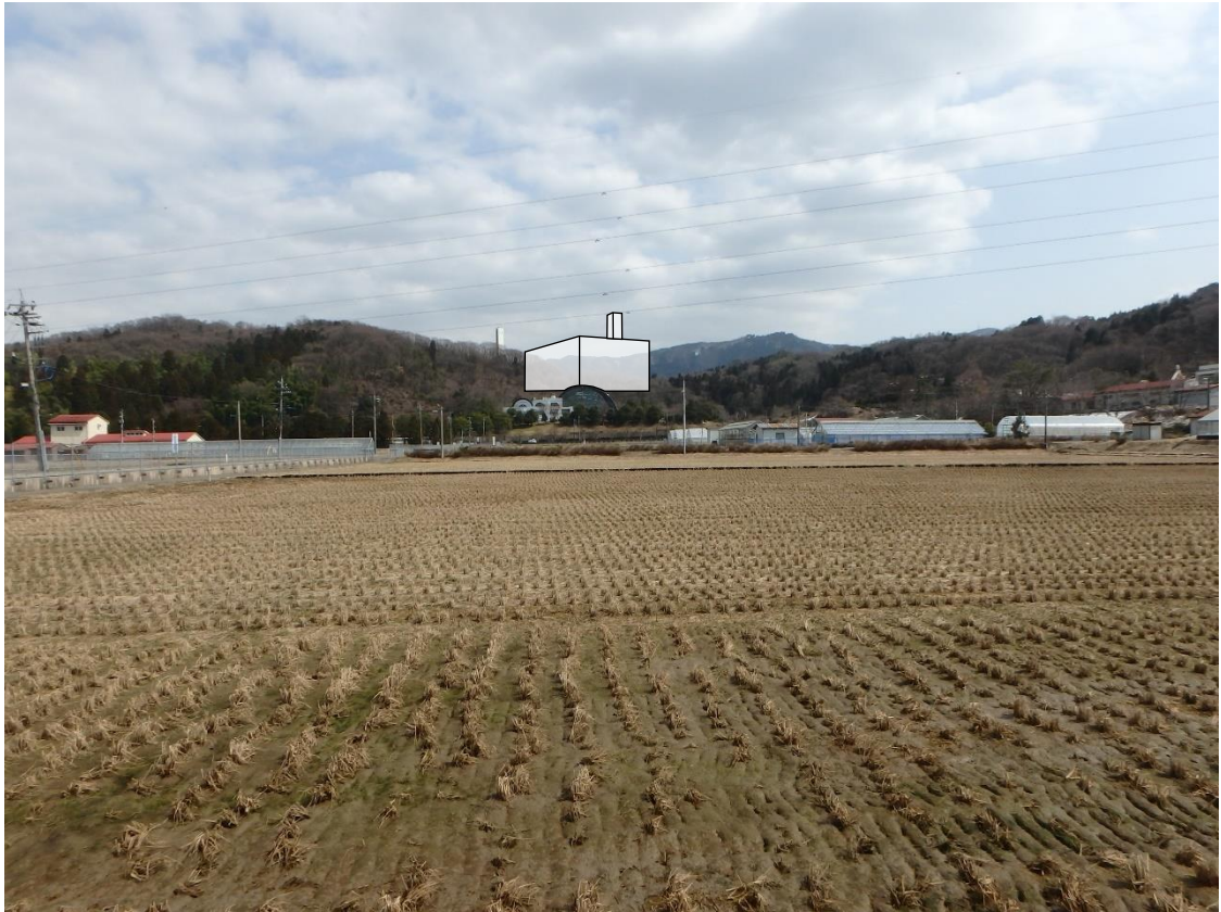
図 5.2-5(1) 地点1からの眺望景観の変化 (A案)