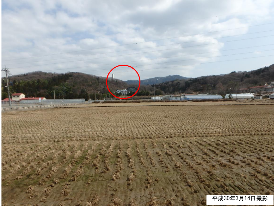
図 5.2-2(1) 事業実施想定区域周辺の眺望景観 (地点1)