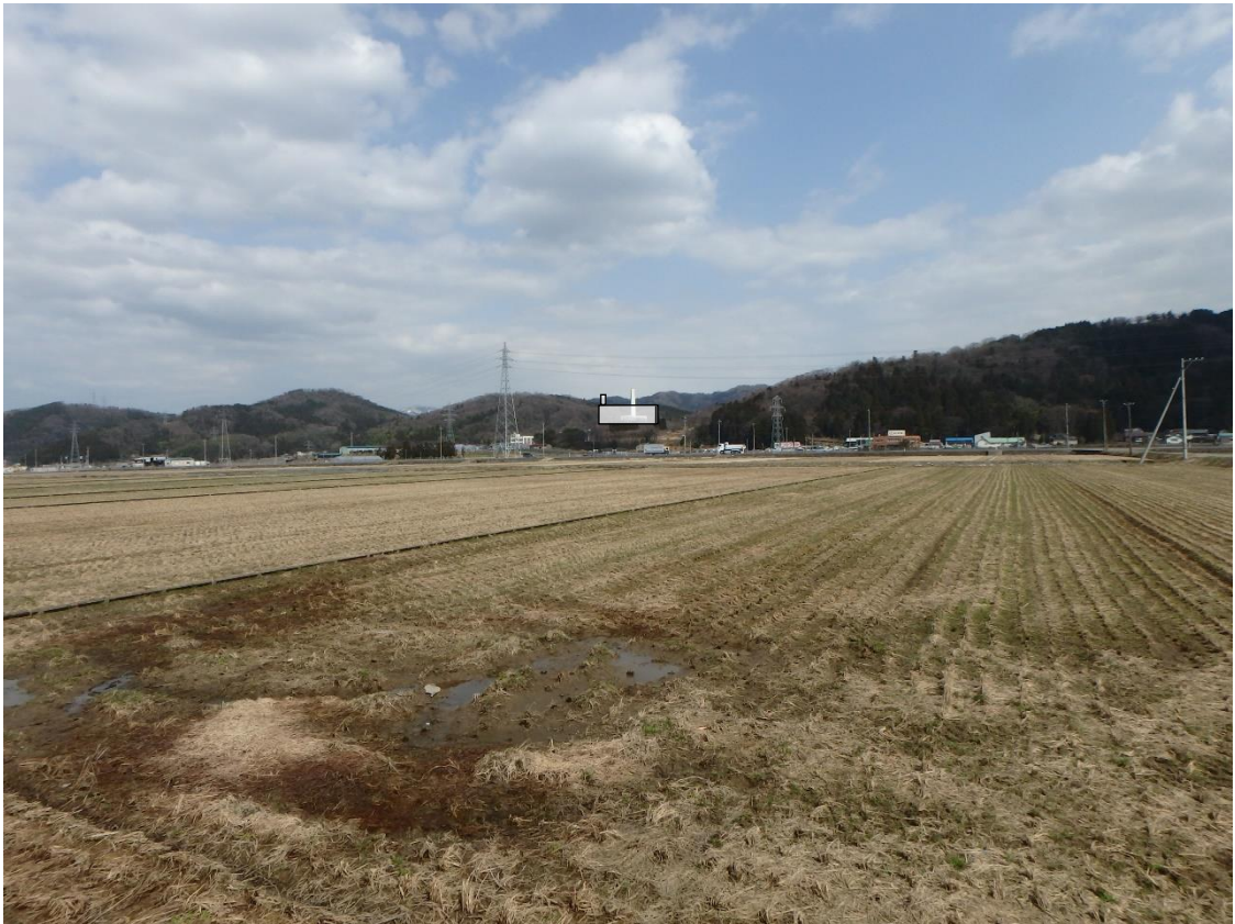
図 5.2-6(2) 地点2からの眺望景観の変化 (B案)