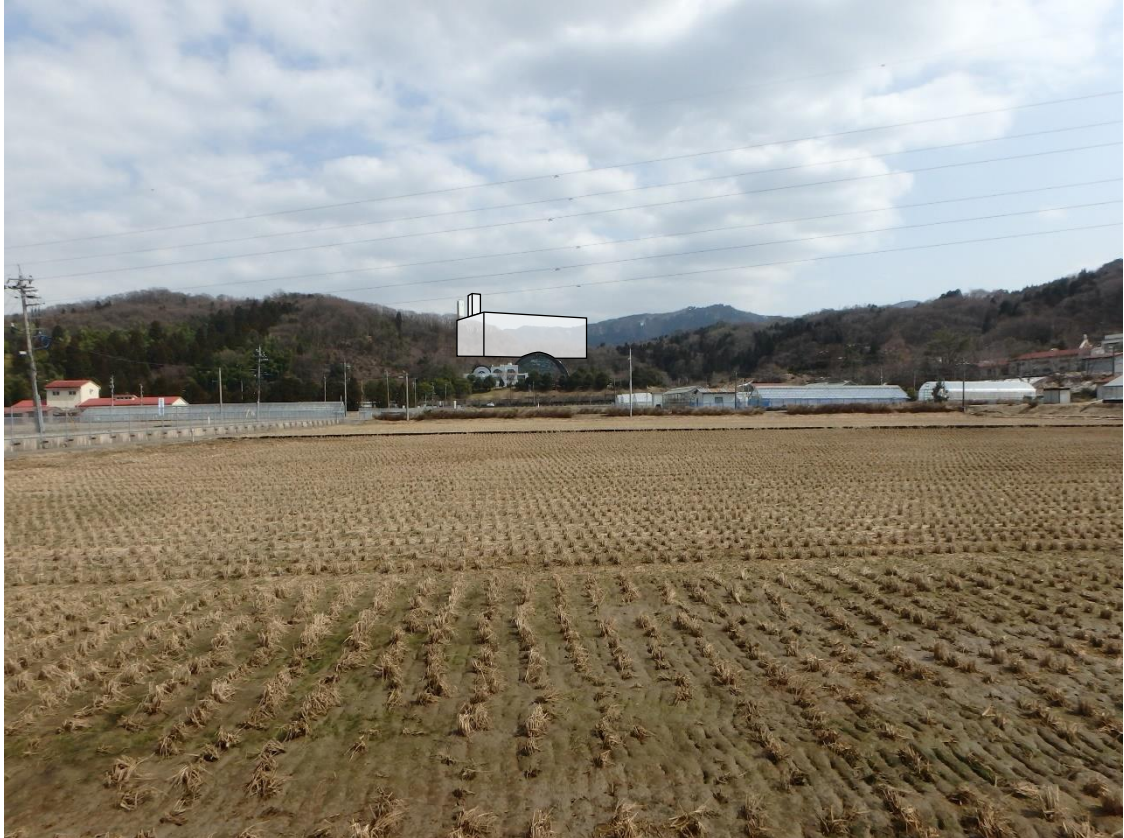
図 5.2-5(2) 地点1からの眺望景観の変化 (B案)