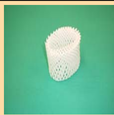
果物などの保護材 * 事業用は不可