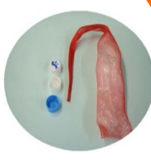
キャップ・その他