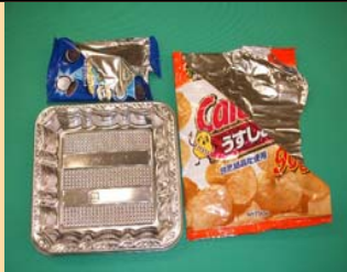
アルミコーティングされたもの (お菓子などの袋)