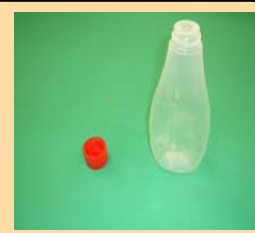
透明なチューブ類 * 汚れのある物は燃やせないごみ