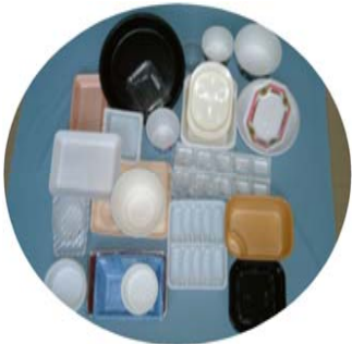
カップ・トレイ類