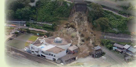
越前水仙の里公園