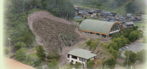
美山アンデパンダン広場