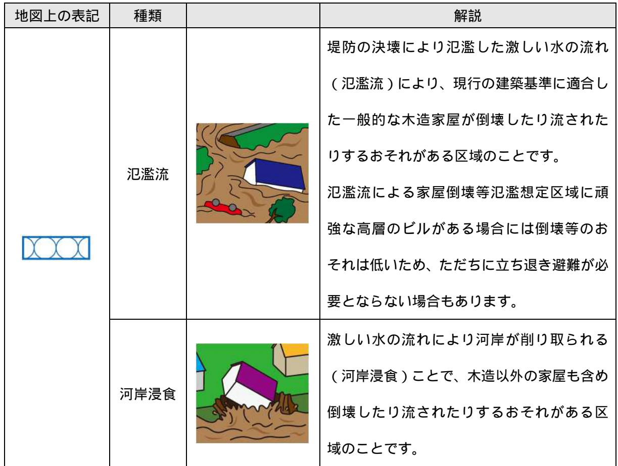
表 家屋倒壊等氾濫想定区域の概要

家屋倒壊等氾濫想定区域とは、最大想定(想定最大規模)の降雨に伴う洪水において想定されるものです。