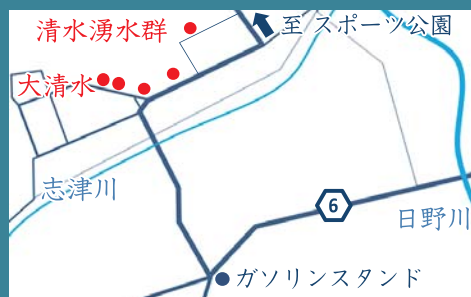
4 清水湧水群 -大清水 福井市清水町