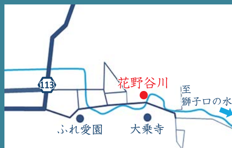
5 花野谷川 福井市花野谷町