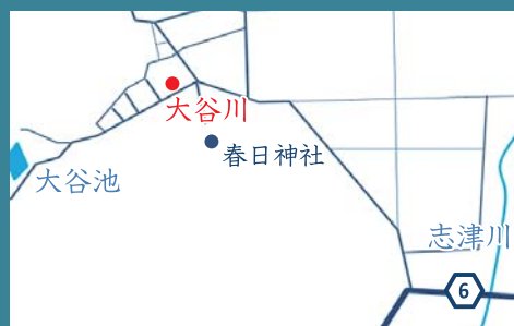
3 大谷川 福井市和田町