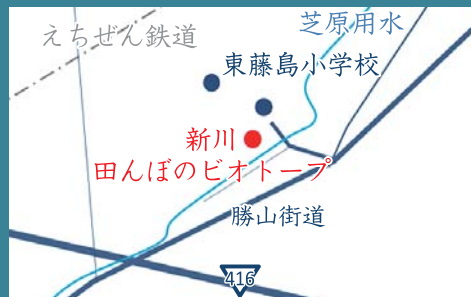
2 新川 田んぼのビオトープ 福井市藤島町 上中町