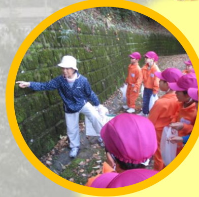
豊小学校児童 八幡山自然観察