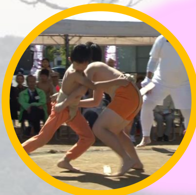
みのり秋祭り 子ども相撲大会