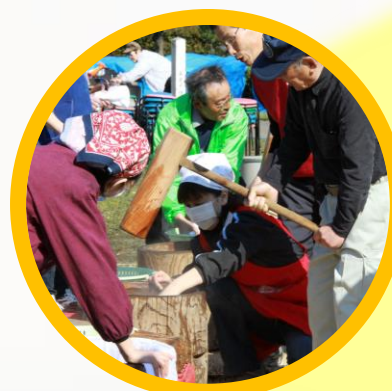
八幡山もえぎ祭り 餅つき大会