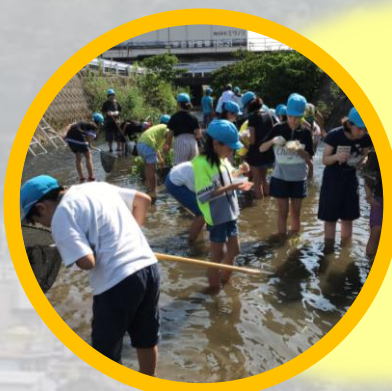
豊小学校児童 狐川生き物水質調査