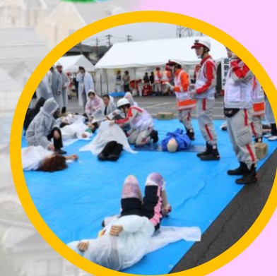
日赤合同災害訓練