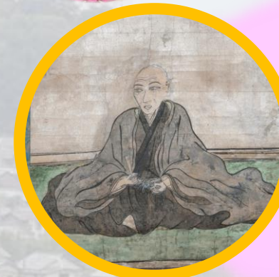
堀秀政公 自画像：長慶寺所蔵