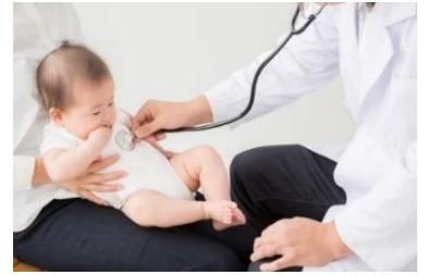
安心な子育て環境の整備

妊娠期から出産・子育てまで一貫した伴走型相談支援を充実するとともに、経済的支援を一体として実施します。