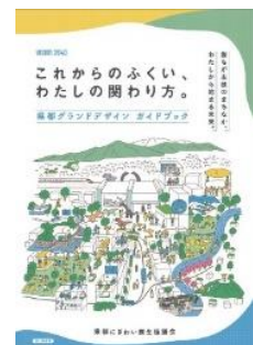
県都グランドデザイン

「県都グランドデザイン」に基づき、足羽川周辺にて親水アクティビティが常時楽しめる環境の整備等、楽しさあふれる県都づくりに向けた各種プロジェクトを推進します。