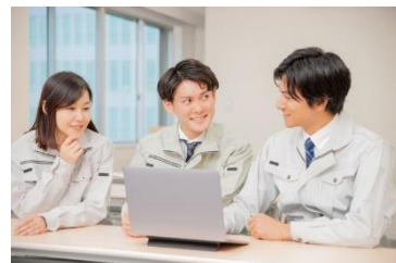
DX化に向けて検討する中小企業

中小企業のDX化、デジタル人材の育成や事業承継を支援することにより地域産業のさらなる活性化を目指します。