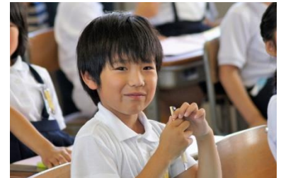
放課後児童健全育成

放課後留守家庭児童の健全な育成と、保護者が安心して働ける環境を確保するため、放課後児童クラブの運営および学童保育利用料助成等を実施します。