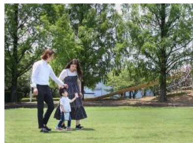
東京23区から移住したOさん家族

親子ワーケーションプログラムの実施など、ワーケーションを活用した本市での居住体験等により、都市部から地方への人と仕事の流れを創出し、将来的な移住につなげます。