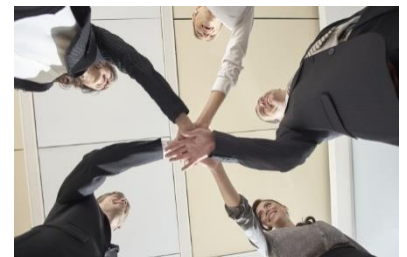
暮らしやすいまちづくり

多文化共生推進のまちづくりを進めるため、通訳員の配置や市民啓発のためのグローバルフェスタ等を行います。