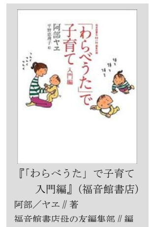
『わらべうた』で子育て入門編』(福音館書店) 阿部/ヤエ//著 福音館書店母の友編集部//編

「てんてんくらぶ」は、このブックスタートのフォローアップ活動として始めたものです。絵本を渡すだけでなく、その後の子育て支援、また図書館に親しんでいただける行事のひとつとして企画しました。