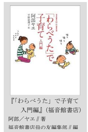
『わらべうた』で子育て入門編』(福音館書店) 阿部/ヤエ//著 福音館書店母の友編集部//編

「てんてんくらぶ」は、このブックスタートのフォローアップ活動として始めたものです。絵本を渡すだけでなく、その後の子育て支援、また図書館に親しんでいただける行事のひとつとして企画しました。