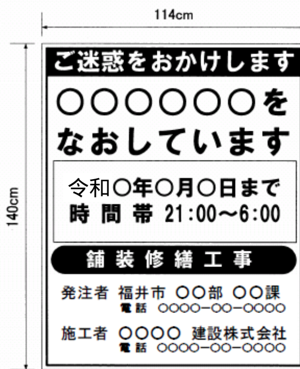
図 1 - 1 - 2 標示板