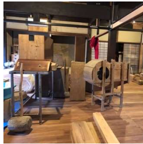
古民家リフォーム の様子