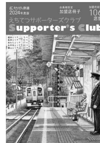
えちてつサポーターズクラブ加盟店冊子