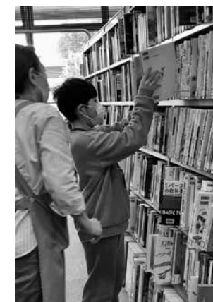
昨年度のこども司書くらぶの様子