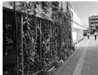
グリーンカーテン(昨年の様子)

とき 5/18(土) 10:00～11:30 ところ アオッサ 研修室 602 対象 市内に住むか、通勤・通学する人(小学生以下は保護者同伴) 内容 グリーンカーテンの育て方に関する講義、えちぜん鉄道福井駅での苗植え(ゴーヤ、アサガオ)の実習 定員 20人(抽選) 参加費 200円(苗のお土産付き) 持ち物 軍手 申込 ①5/9(木)まで②電話、ホームページ③共通事項 問合せ・申込先 福井市環境推進会議(環境政策課内) TEL 20-5609 FAX 20-5754