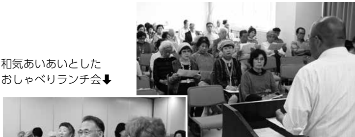
和気あいあいとしたおしゃべりランチ会↓