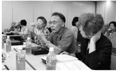
↑防災や福祉、時事をテーマにした講演会には、70～80人が集まる

Data 2013年1月結成。現在は60歳代後半から95歳までの200人以上の会員が登録する。月に1度アオッサで講演会を行うほか、駅前のエコライフプラザを拠点に、毎日日替わりでサークル活動を展開。