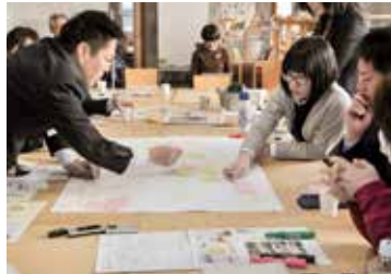
2月15日 ふりかえりワークショップ PJ3