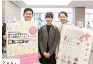
2月4日 福井発! ビジネスプランコンテストにて グランプリ含む三冠受賞 PJ2