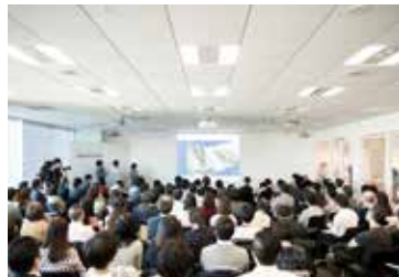
2月19日 東京・ミッドタウンでの発表会 PJ1