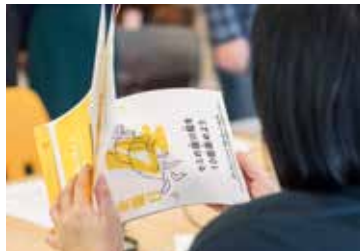
3月4日 発表会直前のプレゼンチェック PJ1