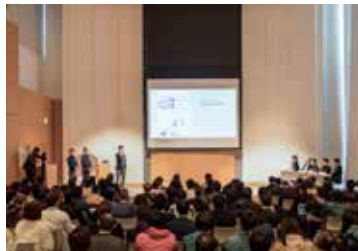
3月11日 福井・福井新聞社での発表会 PJ1