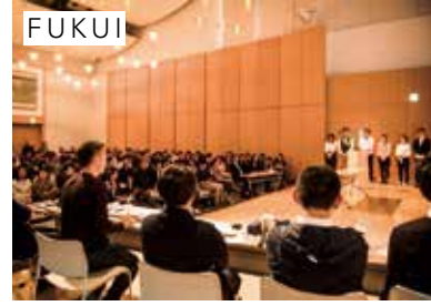
▲ 発表会の前週に東京でリハーサルを行い、さらにアップデートした状態で福井の人たちへプレゼンを行った

発表会を終えた受講メンバーは、いよいよスタートラインに立つことができました。これから福井の新たな魅力を生みだし、未来を少し変えてしまうかもしれない事業が、ここ福井から育っていくことが楽しみになるような発表会でした。