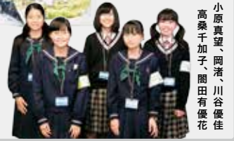
新聞制作：小原真望、岡渚、川谷優佳、高橋千加子、開田有優花

若者にも人気の商品になる、へしこ！ へしこの美味しさを伝える越前漁業協同組合「ぬかちゃんグループ」が手がける「へしこのオリーブオイル漬け」。昔の知恵と今の流行を融合させるおばちゃんパワー恐るべし！