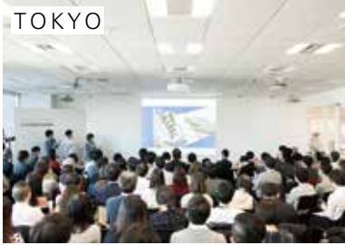
▲ 同会場で開催中の「地域×デザイン2017」展の一角にて発表会を実施。多くの福井出身者も来場した

XSCHOOLの特徴は、受講メンバーそれぞれが独自の視点で福井をリサーチし、これからの社会を洞察しながら、新しい価値を生み出す事業を創出すること。また誰かに依頼されているわけではないので、自分たちが愛情と情熱を持って向き合える企画を構想し、仲間を巻き込んでいく必要がありました。そこで求められるのは、それぞれの「当事者性」。「私はこう思う!」「こうしたい!」「こう考える!」と、自らを主語にして動き、考え、フルスイングで実践することを大切にしてきました。