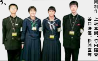
新聞制作：上坂嘉崇、竹内陽香、谷口咲優、松浦直輝