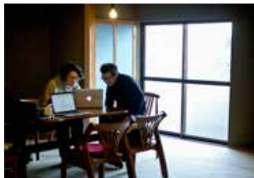
1月28～2月3日 冬の日本海トライアルスタイル1組目 EXTRA PJ