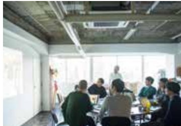
2月12日 発表会直前のプレゼンチェック PJ1