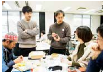
1月28・29日 第5回ワークショップ PJ1