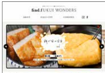
1月19日 WEB「find.f WONDERS」公開