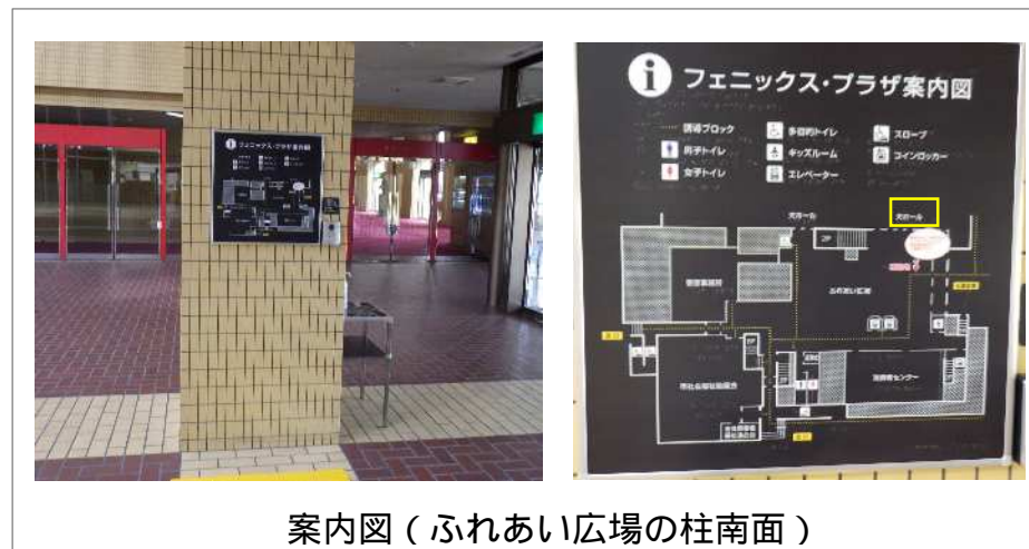
案内図 (ふれあい広場の柱南面)