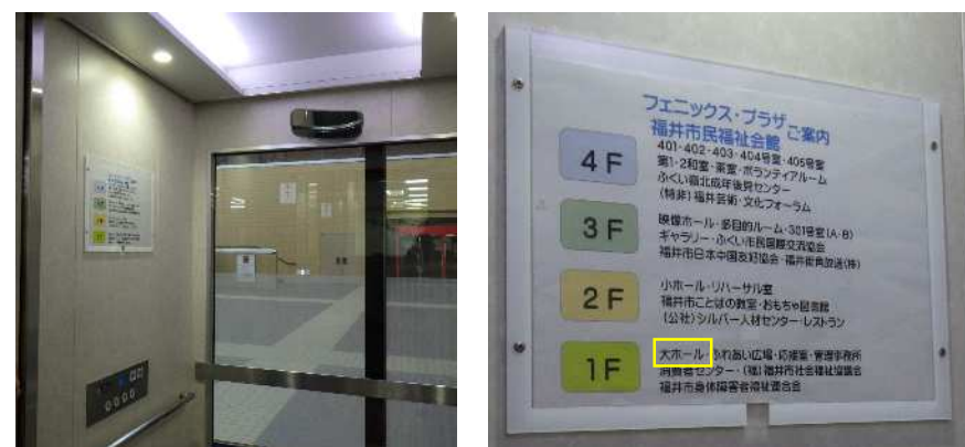
案内 (エレベーター内×2台)