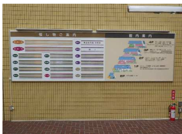
左 催し物ご案内 右 館内案内