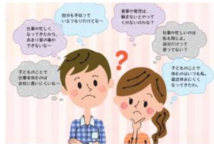
夫婦で納得！「家事・育児シェア」見える化シート

家族の人数、仕事の状況、子どもの成長等に 応じて、その都度見える化シートをチェックし、 チャレンジしていきましょう！