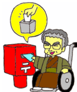
郵便等による不在者投票

福井市選挙管理委員会に投票用紙・投票用封筒を請求し、交付された投票用紙に自宅などで記入し、福井市選挙管理委員会に郵便又は信書便により送付します。