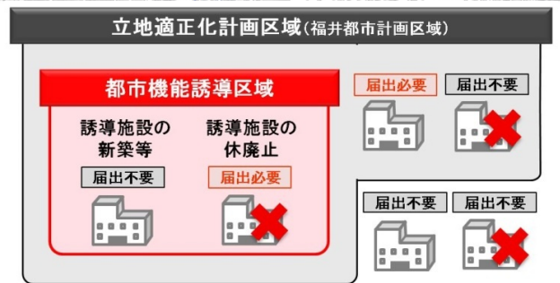
誘導施設の届出イメージ