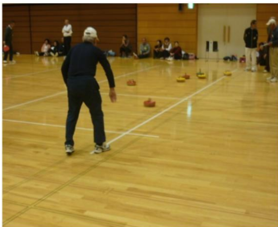
フロアカーリング大会