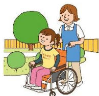
介護サービス 事業所