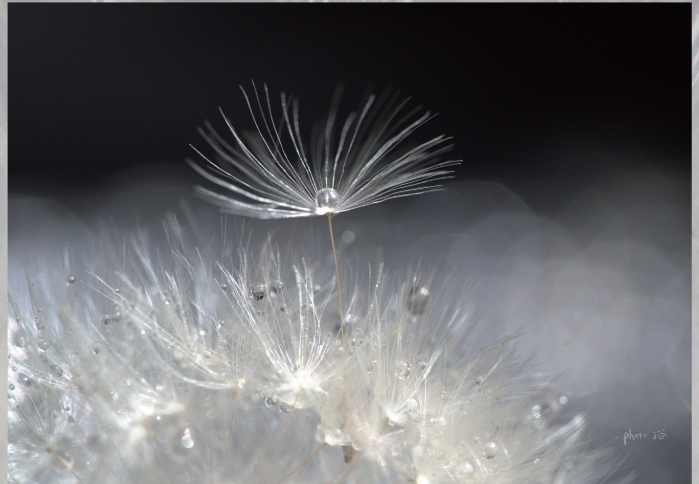
『旅立ちの雫』 / 岩佐裕美 : 第38回市美展ふくい 写真部門入賞作品