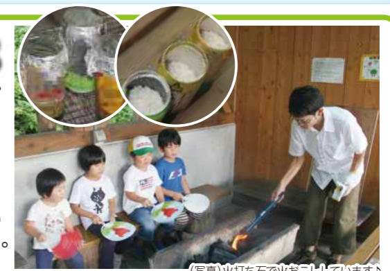
(写真)火打ち石で火おこししています

ありがとうございました。家族全員の 非常食3~4日分 を防災バッグに入れておくのは難しいでしょうから、家の数か所に分けて置いておくの良いですね。一年に一回日を決めてそれを食べて、新しいものと入れ替える。ツナ缶などは少しだけ蓋を開けて油の部分に木綿の紐をさせばろうソクの代わりに使用できます。