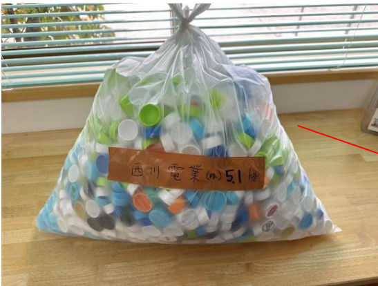
エコキャップの売却金で、海外の子どもたちにワクチンを提供する「ふくいエコキャップ運動」に参加