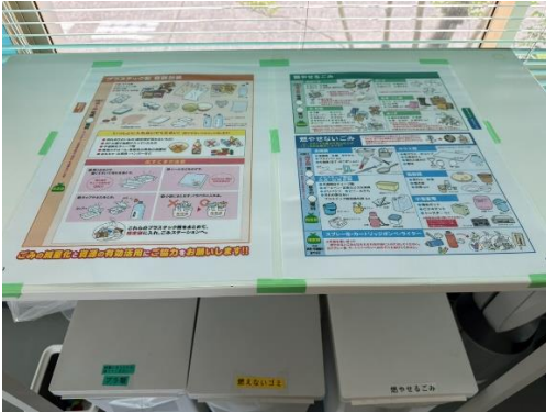
ごみの分け方をごみ箱に掲示して従業員に啓発している