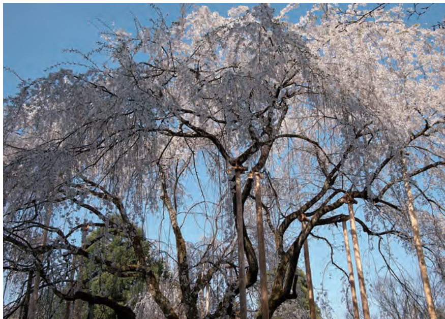
足羽神社しだれ桜