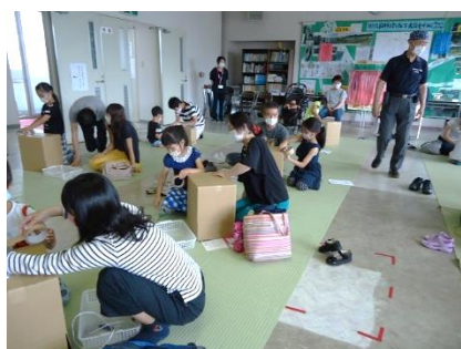
段ボール箱を組み立てます。