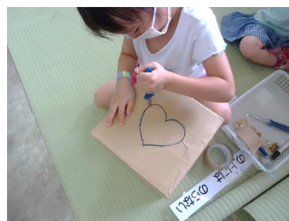
ダンボールカッターで穴あけ