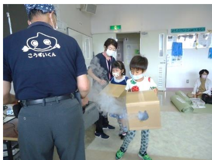
完成したら中に煙を入れてもらいました。 的に向かって空気砲発射!