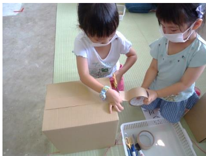
紐を通して6か所ガムテープ貼り