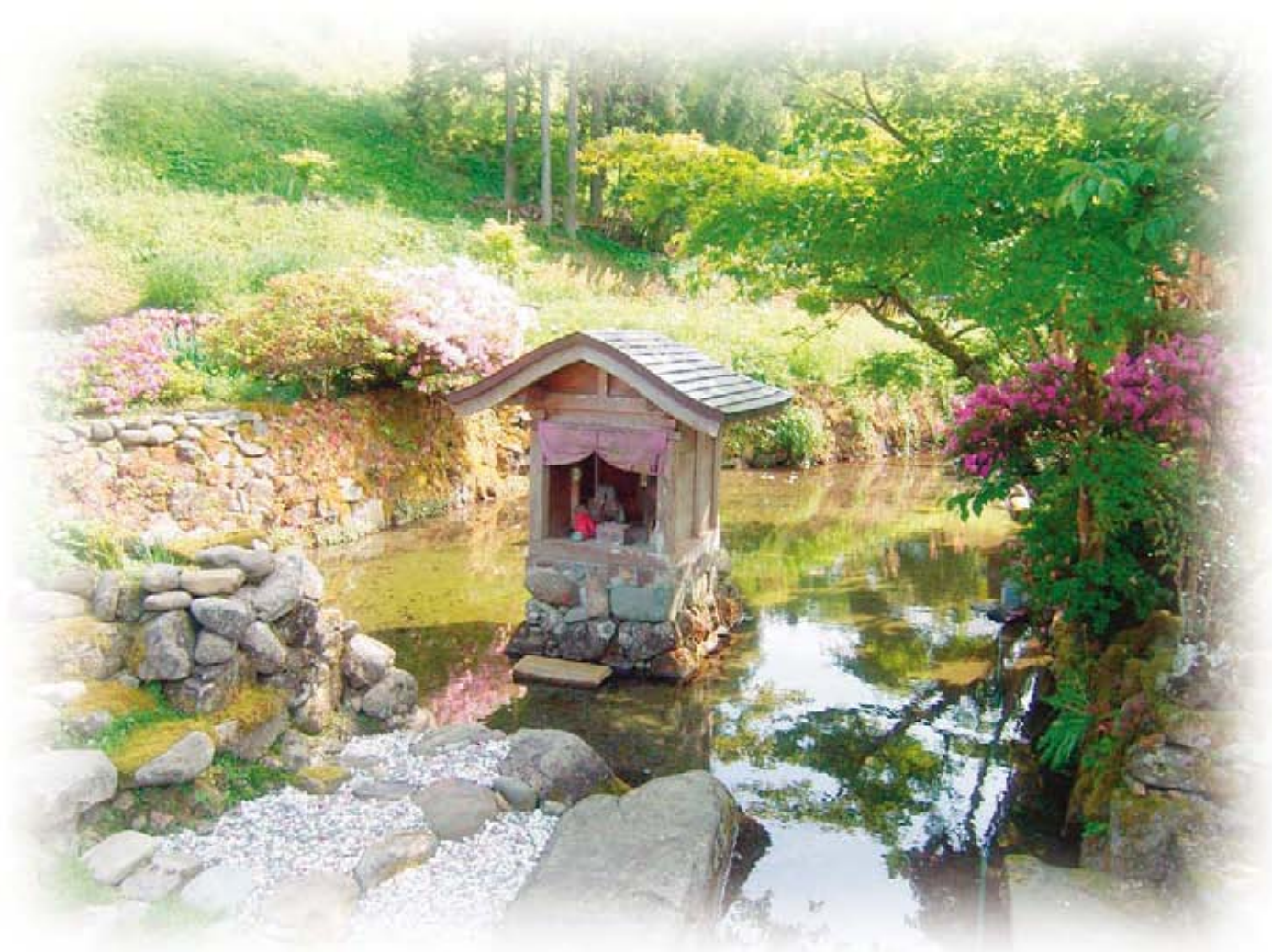
福井市 城戸ノ内町 「瓜割清水」