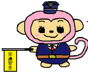
福井市交通安全マスコット まもりーね

福井市では、運転免許を返納された満65歳以上の方への支援を行っています。 (対象は、平成28年4月1日以降に運転免許を返納された満65歳以上で福井市内に住所を有する方です。)