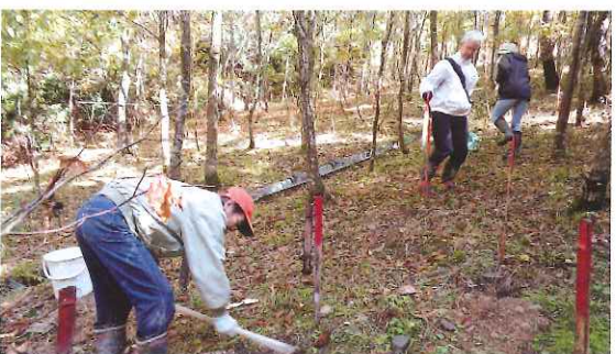
ボランティアによる森づくり活動 (永平寺町)