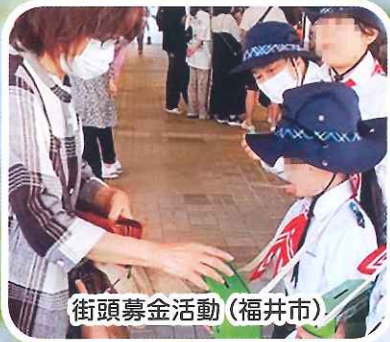
街頭募金活動（福井市）