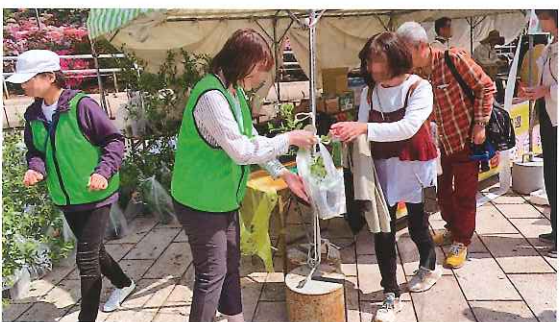
緑化苗木の配布活動 (鯖江市)