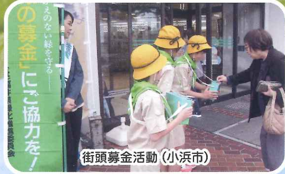
街頭募金活動（小浜市）