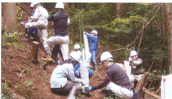
子ども達の森林学習活動 (小浜市)