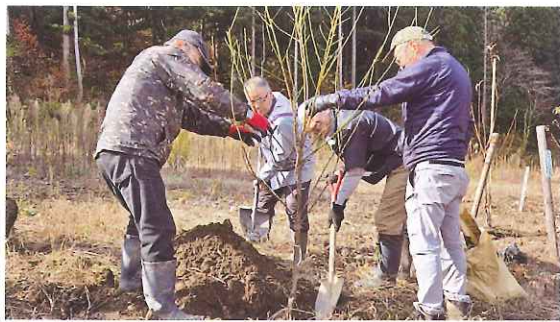
地域での緑化活動 (大野市)