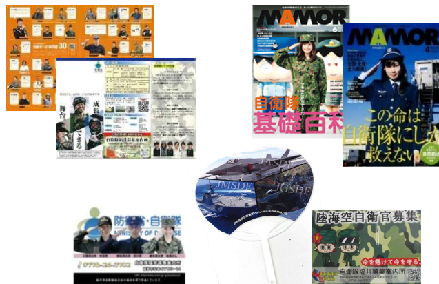
④広報リーフレット・ティッシュ等の作成 広報誌の高校等への配布