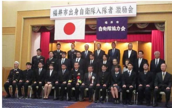
③福井市出身入隊者激励会