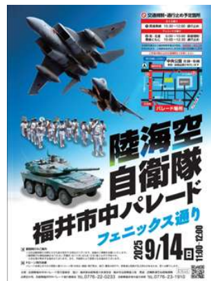
②福井市中パレード協力