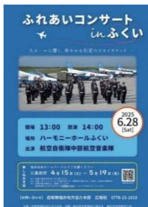
①ふれあいコンサート協賛