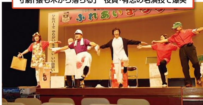
寸劇「猿も木から落ちる」 役員・有志の名演技で爆笑