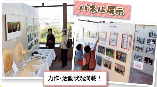
力作・活動状況満載！