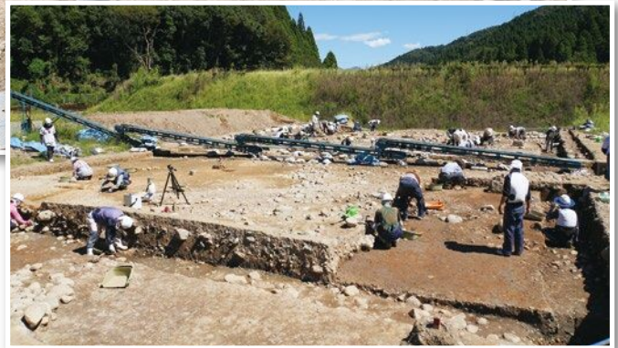
▲福井市の一乗谷朝倉氏遺跡発掘調査の現場で作業をする会員ら