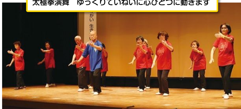
太極拳演舞 ゆっくりていねいに心ひとつに動きます