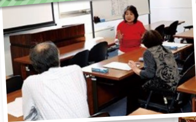
入会説明・就業相談会