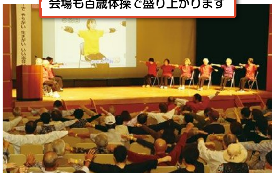
会場も百歳体操で盛り上がります