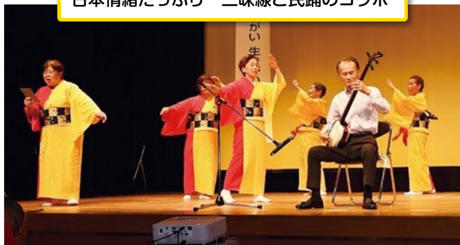
日本情緒たっぷり 三味線と民謡のコラボ