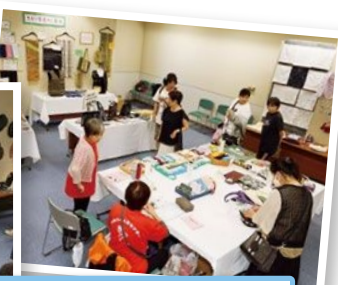
探します！ 欲しいものがいっぱい！