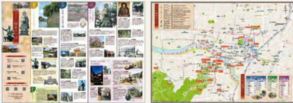
ふくい歴史マップ

ご希望の方に無料で配布しています。 どうぞご利用ください（ただし、数に限りがあります）。