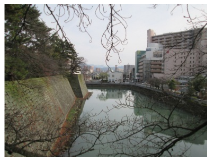
城址から見た山並み景観の保全を行う