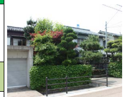
花・樹木による緑化