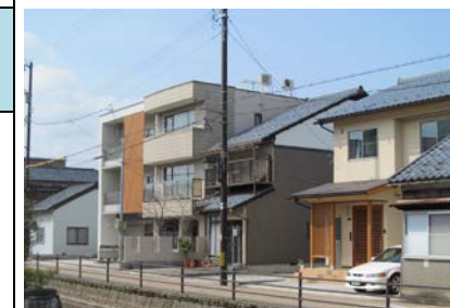
周辺景観への配慮