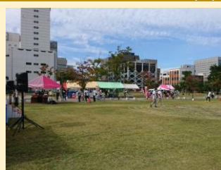
⑪サッカーフェス実行委員会