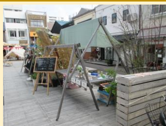
⑥NP0法人森のほうかごがっこう