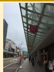
④エキマエモールシビック プライドキャッチコピー プロジェクト実行委員会