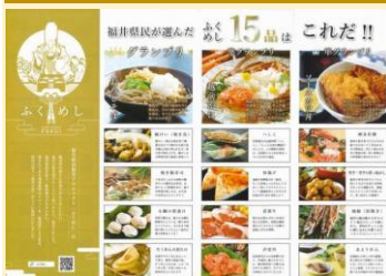
⑤ふくめし実行委員会