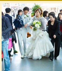
⑦City Wedding 実行委員会