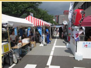
⑨まちづくり福井(株)