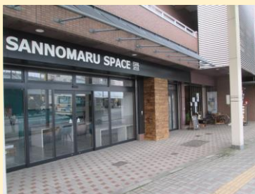
⑫サンノマルスペース