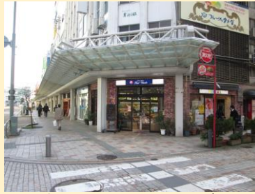
②フルーツのウメダ