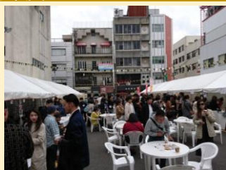
⑩サンロード北の庄商店街 振興組合