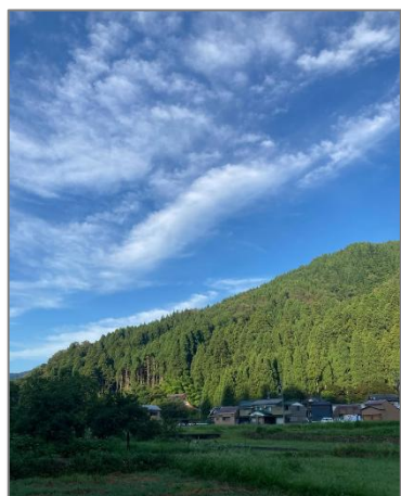
<美山の自然豊かな日常>