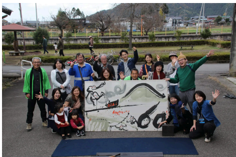
2020年12月。越美北線の還暦を祝うイベントを自主開催！