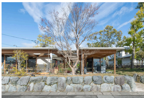
隣接のキッズケアラボの子どもたちが店に来ることも。