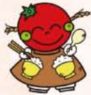
福井市食育マスコットキャラクター「ふくい たべまるちゃん」