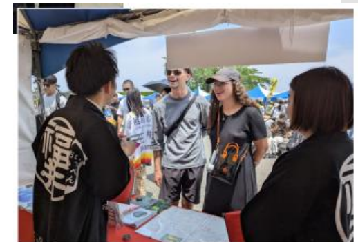
誘客プロモーション