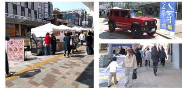
まちなかイベント（イメージ）