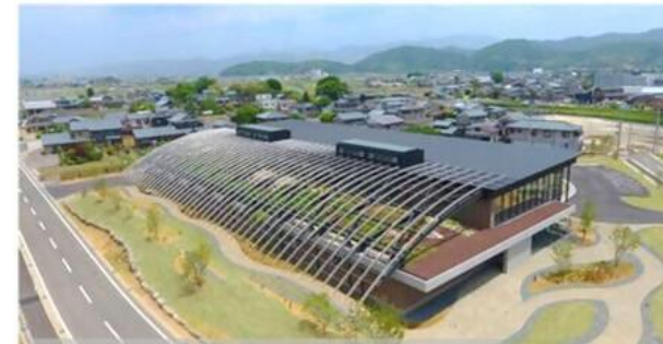
立地を支援した企業