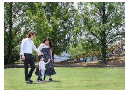
東京23区から移住したOさん家族

移住に関心のある県外在住者に対し、本市の魅力発信や生活体験を提供することにより、将来的な移住につなげます。