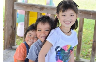
子どもの遊び場の充実

地域子育てセンターや児童館において、遊具・玩具の購入やイベント等を実施し、子どもが身近なところで安心して遊ぶことができる遊び場の充実を図ります。