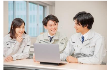
DX化に向けて検討する中小企業

中小企業のDX化、デジタル人材の育成や事業承継を支援することにより地域産業のさらなる活性化を目指します。