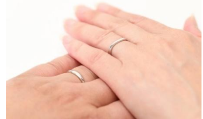
結婚に対する機運醸成

子どもを望む方に対し、保険適用回数終了後等の先進医療にかかる費用を市が独自に助成することで経済的負担軽減を図ります。また、精神的負担軽減のための相談事業も行います。