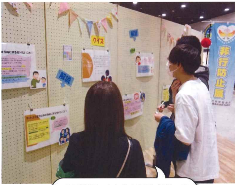
今回は若い人たちも興味を持って展示を見てくれました