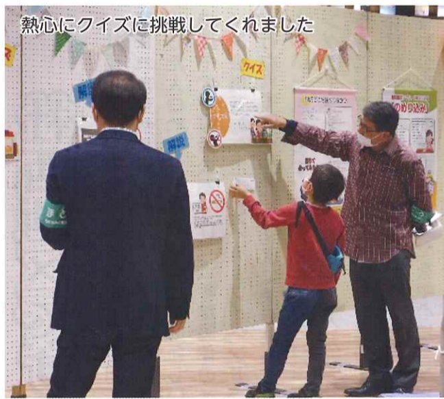
熱心にクイズに挑戦してくれました

今回の非行防止展の企画がとても良かったと思います。18歳からの成人と身近な話題をクイズにすることで、具体的な問題となり、絵手紙展にも立ち寄り寄ってくださった方々が興味をもってパネルを見てくれたように思います。絵手紙の人気投票も声をかけるチャンスにつながりました。 中学生男子3人組に声をかけると、恥じらいながらもクイズに挑戦してくれました。1人で母親と待ち合わせの間、真剣に取り組んでくれた小学生高学年女子は母親が来て待ってもらいながら最後まで仕上げていました。 これまでは風船目当ての幼児の保護者が多く、もっとテーマに沿った方にも見てもらいたいと思っておりましたので、今回は関係者に近い方々に関心をもっていただけたのではと充実していたように感じました。コロナ禍の中、色々な工夫で行動していくことが大切だと思います。携わってくださった皆様、ありがとうございました。 (地区補導員)