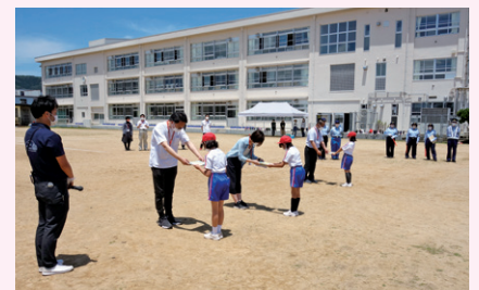
〔贈呈式のようなす〕

社北支部では、社北小学校と協力して、子どもたちが危険を感じた場合に駆け込む「子ども110番の家(かけこみ所)」や、不審者を目撃した場合の連絡先等を記載した「安全マップ下敷き」を作成し、3年生に贈呈しました。