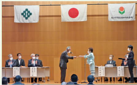
〔表彰式のようなす〕