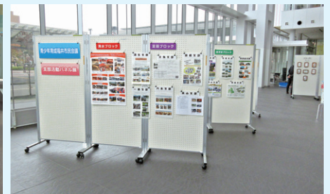
〔パネル展のようなす〕

子ども・若者育成支援強調月間(11月)に先がけ、「地域の子どもは地域で守り育てる」をモットーに、見守り活動や危険箇所点検など、子どもたちの安全・安心のために活動する、支部の皆様の様子をパネルで紹介しました。