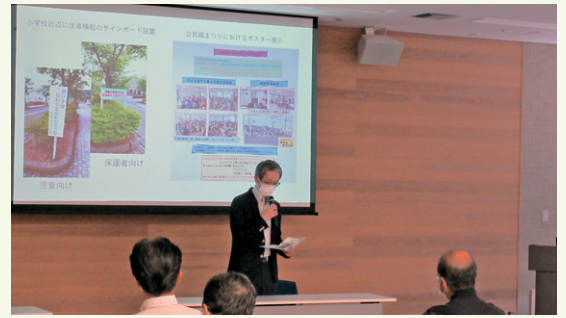
〔事例発表のようす〕