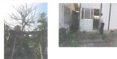
羽根田地の空き家 (鍵がかかっている)