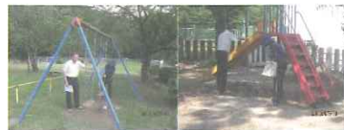
危険箇所で見つかった場所の点検