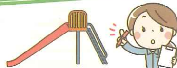
保育園が屋外で遊ぶ公園の遊具点検 (保育園関係者)