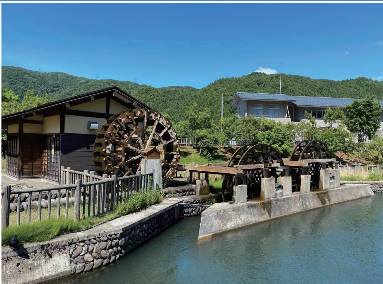
世界かんがい施設遺産 足羽川用水（一乗谷あさくら水の駅）

福井市大手3丁目10番1号 TEL 0776-20-5550 FAX 0776-20-5558