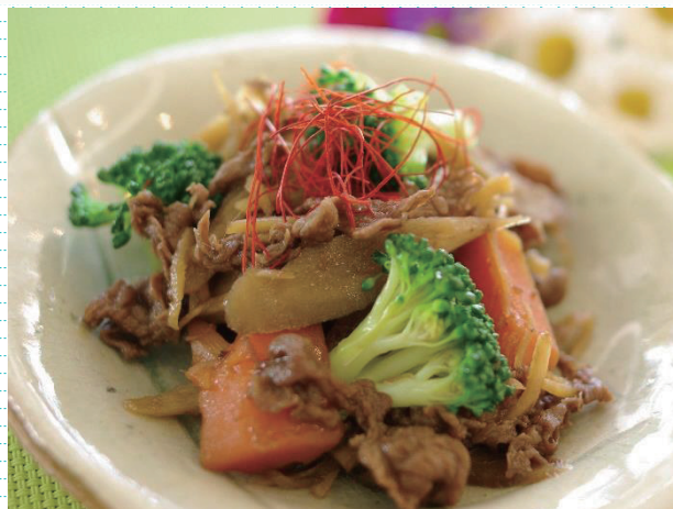
牛肉と根菜のしぐれ煮