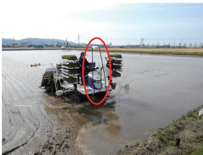
▲赤色の囲み部分が、GPSアンテナ

現在福井市では、産地や農業従事者の育成、農業所得を向上させるための支援策としてスマート農業の補助制度を設けています。今後は、ますます農業従事者の高齢化や米価の下落など大きな社会問題に直面することが危惧されます。この取組事例のような先端技術の導入により問題解決につながることが期待されます。