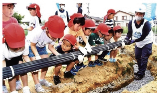
水はけバスターズ参上!!(福井新聞に掲載)