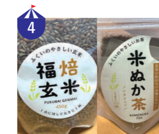
4 ぼんぼちっ株株式会社 福井県の農薬不使用、化学肥料不使用の玄米、米ぬかを使った商品を販売。玄米を、毎日手軽に食べてほしいとの思いを込めて。