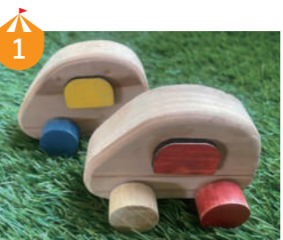
1 森のおもちゃづくり 福井の森から生まれた木のパーツで自分好みにカスタマイズできるキーホルダーや車をつくらう!