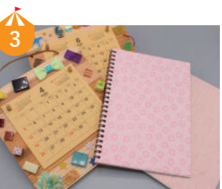
3 カレンダーのにしぼた 県産木材のカレンダーボードと越前和紙を使ったノートづくり。越前編や鯖江産眼鏡素材などのかわいいデコレーション体験ができます。