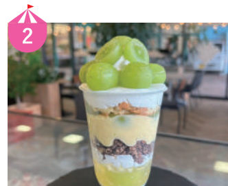
2 MYOJO FARM 北陸最大規模のいちご農園『明城ファーム』の直営カフェ。今回は、福井県産のシャインマスカットと梨を使った絶品パフェをご用意!