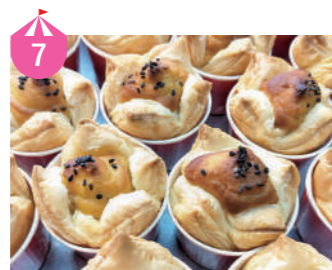
7 郷土菓子処 香月 福井県あわらとみつ金時を使った焼き菓子や、眼鏡をモチーフに作られた琥珀糖、芦原の栗を使った栗赤飯などを販売します。