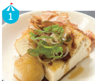
1 岸田食品 油の中で何度もひっくり返してふっくら膨らんだ美味しい福井の厚揚げ!揚げたてを出汁醤油でお召し上がりください!