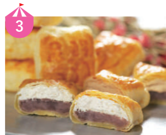
3 創作和洋菓子 花えちぜん 100種類を超えるオリジナルスイーツを製造販売しております。福井にちなんだ銘菓やメディアで話題のスイーツをお楽しみ頂けます。