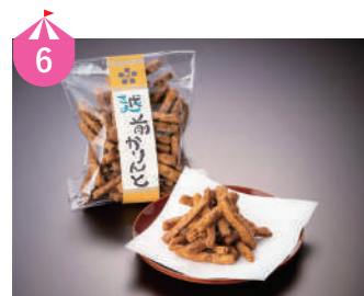
6 越前かりんと 越前市産の大豆を生地に練りこんだ手作りの大豆かりんと。地元の麦茶やバジル入りなども人気です。