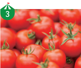
3 農事組合法人 ファーム順天 全国ミニトマト選手権入賞銀賞を受賞した高糖度トマト恋の実を中心として、トマトジュース、ドライトマトを販売します。