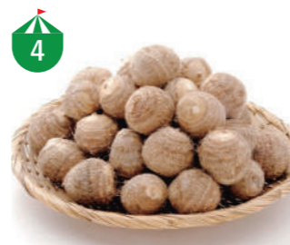
4 (一財)越前おおの農林楽舎 地元大野の風土と名水に育まれた自慢の朝採れ野菜を生産者に代わって販売します!