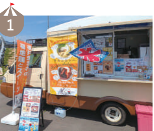
1 黒ちゃん家 福井の地鶏「福地鶏」をつかったご飯もの、卵たっぷりのお菓子を販売します!