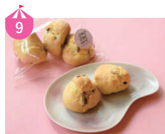
9 パナデリア 大野の名水を使ったパン生地を使用。地元名産を取り入れた「すこスコーン」や、地元グルメリを使った「醤油カツバーガー」を販売!