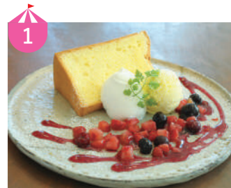
1 Snowcafe 県産卵使用の極上食感の大きなシフォン。越前甘エビを使ったエビ青のりのシフォンも今限定で登場。