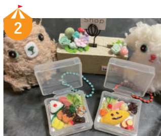
2 しまこの手仕事 好きなミニチュアパーツを選んでポンドで貼り、お弁当を作ります。小さいお子様もできます。