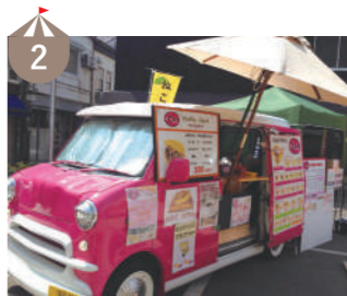
2 クレープ・プラスカフェ 嶺北産のさつまいもや旬の果物を使ったクレープを提供。県産の米粉を使ったクレープもあります。