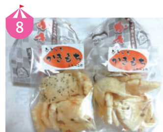
8 もちっこ会 85才のハデ子さん、91才のフジ子さんの二人が地元のお米で作るかき餅。おかげさまで25年以上にわたり皆様に愛されてきました。