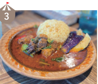
3 〜カレーと和とお酒のお店〜 本道坊 2021ミシュラン北陸掲載!和とスパイスが融合したコクと旨みの日本風インドカレーを販売します。