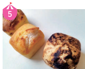
5 カゼミドリ 生のお米から作るグルテンフリーパン。福井県産の玄米や5分づき米を使用。