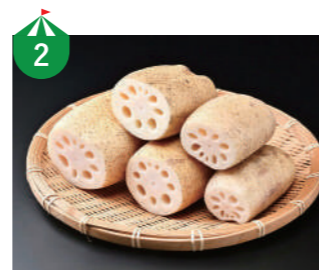
2 あわら旬彩魅力宣伝隊 あわら、坂井の農家が新鮮な農産物を持ち寄り販売します!!