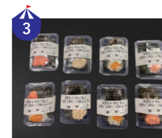
3 Mr.コシヒカリ 自ら育てたこしひかりを使用した具だくさんでふわふわ食感のおにぎりや、お弁当を販売します。