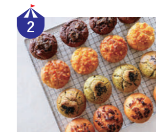
2 日のごはん 素材の味を活かすため、自家製調味料などを使用した無添加そうざいを販売します。身体にやさしく仕上げた味をお楽しみ下さい!!