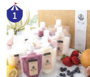
1 あすわの実 福井の食材をたっぷり使ったお弁当や米糍のスムージーやプリン、そしてとれたて野菜まで幅広く販売します。