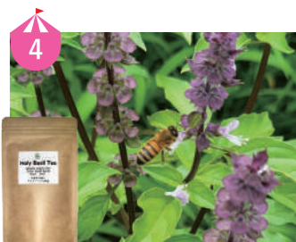
4 坂井市竹田のホーリーバジル農園 インド原産のハーブ、ホーリーバジルを無消毒で除草剤や化学肥料、農薬も使わず毎年種から栽培しています。