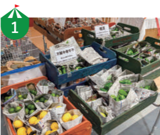
1 みくるまファーム 永平寺町で無農薬、無化学肥料で野菜・果樹を生産しています!

お野菜 デリ&加工品 スイーツ&ティー キッチンカー ダイニングエリア ワークショップ&実演