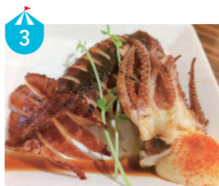
3 おいで康 旬菜鮮魚と炭火焼 福井の地魚を美味しく料理し提供しています。今回は越前の海でとれた「いか丸焼き」を炭火焼きで秘伝のタレで仕上げます。