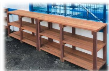
《調度品》木のおもちゃ、テーブル等