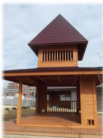
《木質化》園庭のあずまや