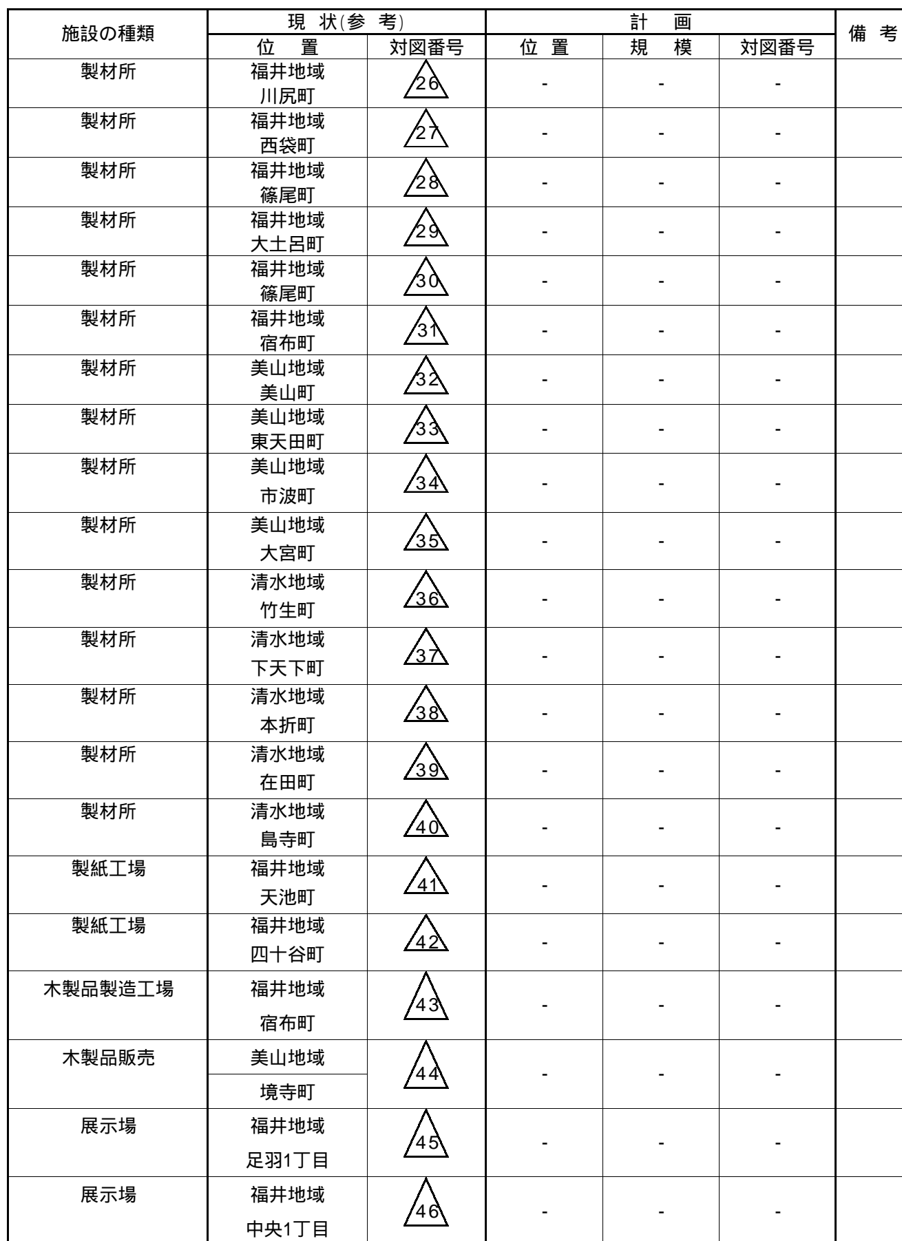
別表6 林産物の生産(特用林産物)・流通・加工・販売施設の整備計画