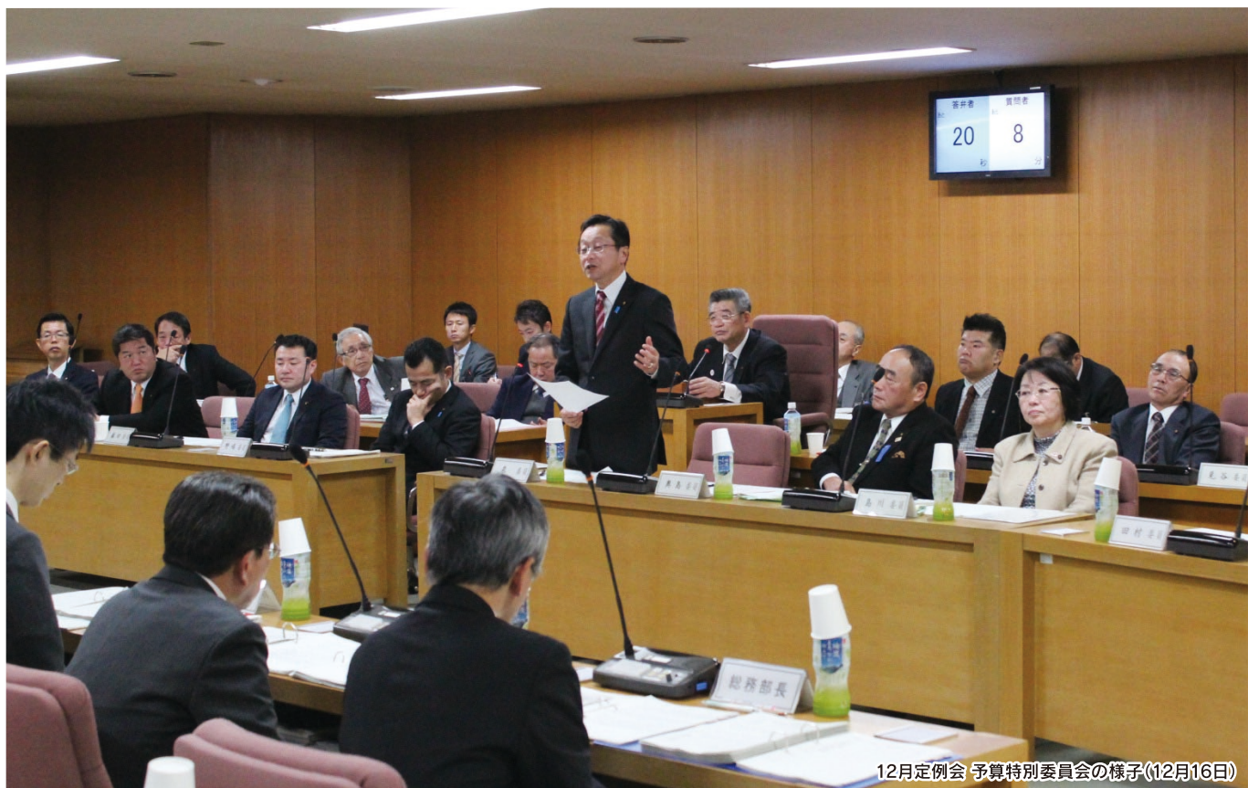
12月定例会 予算特別委員会の様子(12月16日)