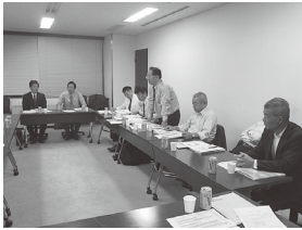
相模原市での視察の様子