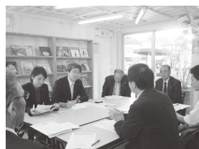
「わいわい!!コンテナ」での説明の様子