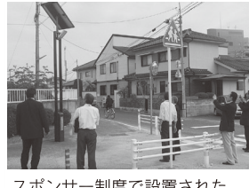
スポンサー制度で設置された道路照明灯を視察する様子