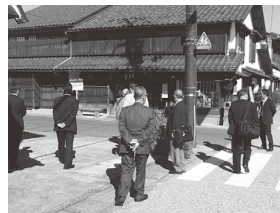
倉吉市の町並みを視察する様子