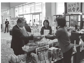
道の駅「藤川宿」での視察の様子