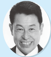
かたや しゅういち