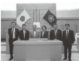
富士宮市での視察の様子