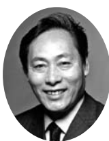
落語家・タレント ヨネスケ氏