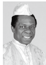
オスマン・サンコン 氏